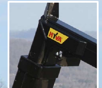
Acero de alta calidad