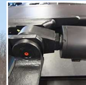
Diseño de pasador de seguridad doble