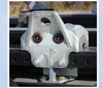
Soportes del contenedor chapados en zinc