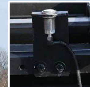
Montaje de accesorios atornillados