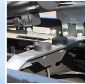
Cojines para brazos